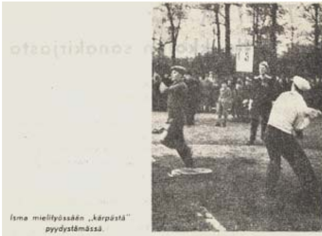
Isma miellytyksensä „kärpistä“ pyydystämässä.