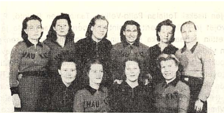
Haukattaret neljännen kerran Suomen mestareina v. 1946