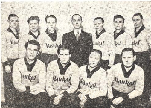
Nykyinen miesten pesäpalloedustusjoukkue.

Sarjakiilpailujen lisäksi ovat Haukat suorittaneet lukuisan määrän pokaali- ja ystävyysotteluita. Vaatehimo Tajloro'n lahjoittamasta "Haukka" maljasta oteltiin vuosina 1930-1935 Suomen Valkoisen Kaartin pesäpallojoukkuetta vastaan. Maljan säännöissä määrättiin siitä pelattavaksi viiden vuoden aikana viisi ottelua vuodessa. Vuosikiinnityksen sai se joukkue, joka oli voittanut useimmat saman vuoden aikana pelatut ottelut. Vuonna 1933 olivat vuosikiinnitykset tasan 2-2. Seuraavana vuonna ei maljasta oteltu ja vuonna 1935 sai SVK kolmannen kiinnityksen maljaan, voittaen sen omakseen.