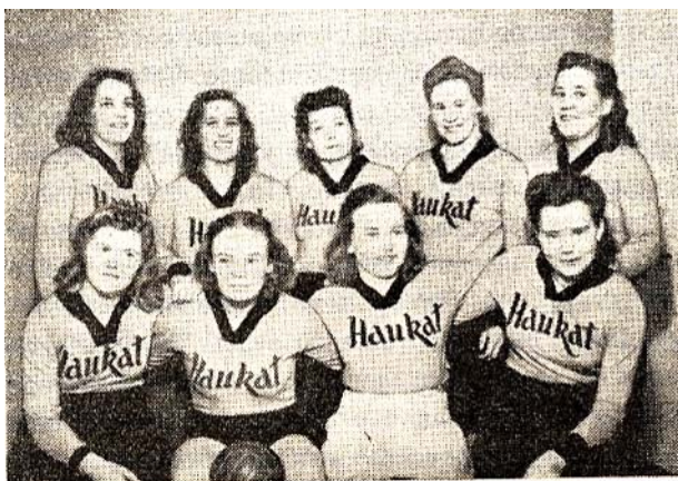
Haukkojen naisten käsipallojoukkue v. 1948.