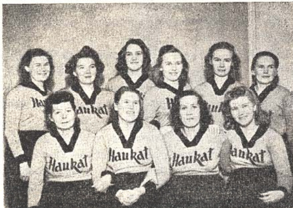
Naisten reservijoukkue, joka 1948 voitti H.gin piirin B-sarjan pp. mestaruuden