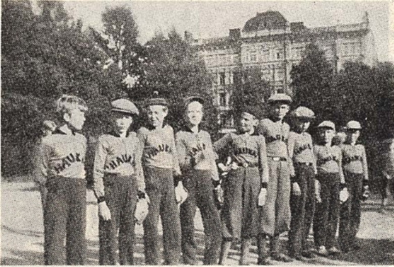
Poikajoukkue Kaisaniemessä v. 1933